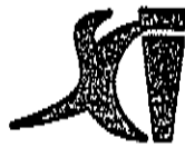
Tabela de Notas e de Protestos de Letras e Títulos - ITAPEVA - SP AUTENTICO a presente cópia reproduzida conforme original a mim apresentado, de que dou fé