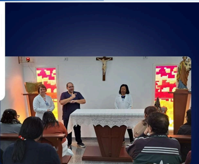
PROJETO EDUCAÇÃO EM SAÚDE COM ACOMPANHANTES

Juntos, fortalecemos vínculos e promovemos saúde!