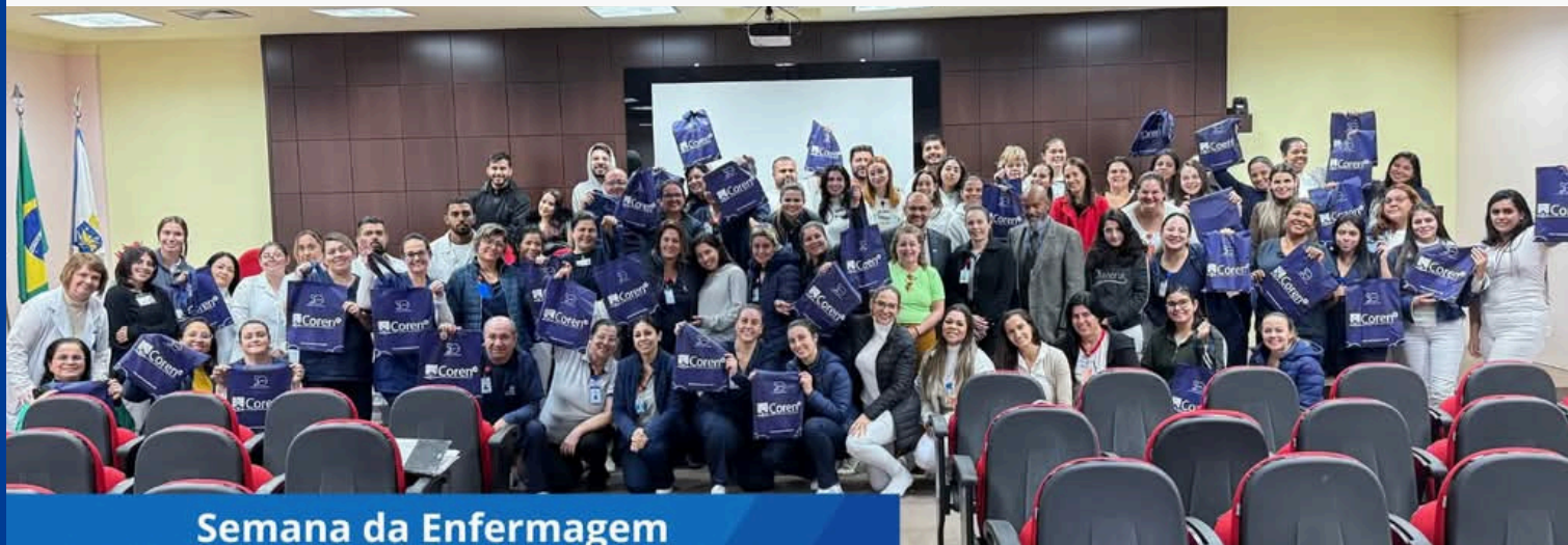
Semana da Enfermagem