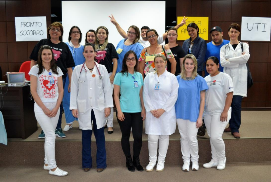
Acima, equipe multiprofissional da UTI, que organizou o evento

→ Confira o vídeo publicado na página do Santa Saúde no Facebook