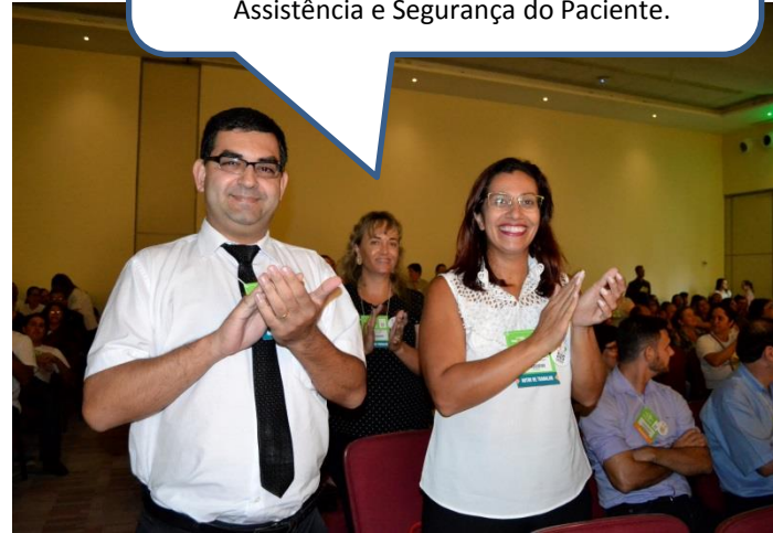
Evento aconteceu no Centro de Convenções Rebouças, em São Paulo