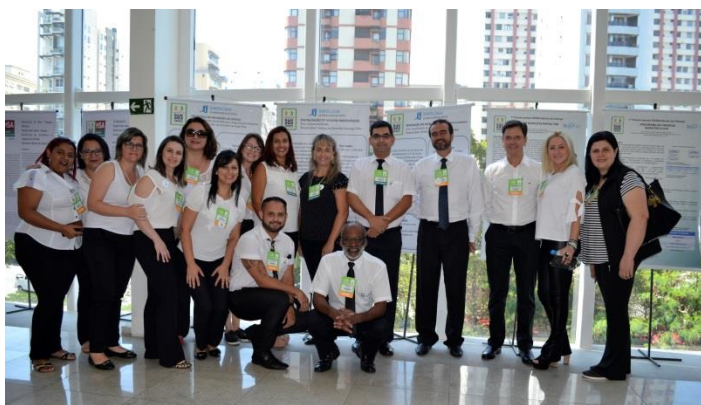
Equipe Santa Casa