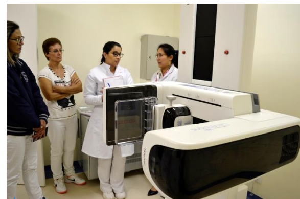
Equipe recebendo o treinamento

Altíssima tecnologia! Exclusividade Santa Casa!