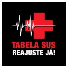
Tabela SUS, reajuste já!

Ação conjunta mobilizou 83 Santas Casas e Hospitais Filantrópicos em protesto contra os baixos valores praticados pela tabela SUS